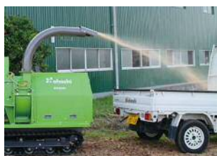
Déversement sur camion