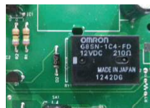
No Stress Micro ordinateur