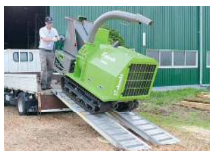
Chargement facile sur camion