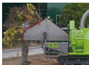
Branches feuillues OK