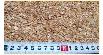
Tamis à mailles de 12 mm

Les différentes tailles de copeaux permettent des utilisations variées. Choisissez la taille des mailles du tamis en fonctions de vos besoins.