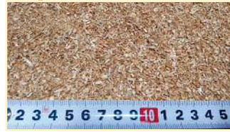
Tamis à mailles de 6 mm