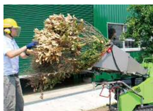
Branches feuillues OK