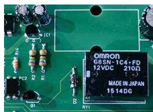
No Stress Micro ordinateur