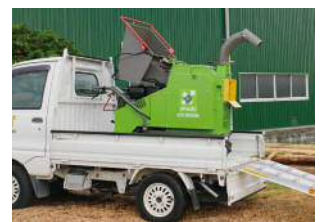
Possibilité de chargement sur un camion léger ou une remorque