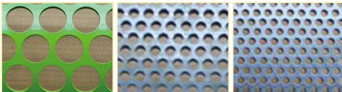
Tamis à mailles de 5 mm