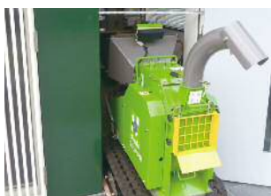
Largeur de seulement 73 cm !